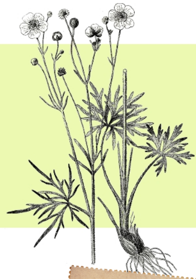
Herbář - z latinského slova herba - bylina.