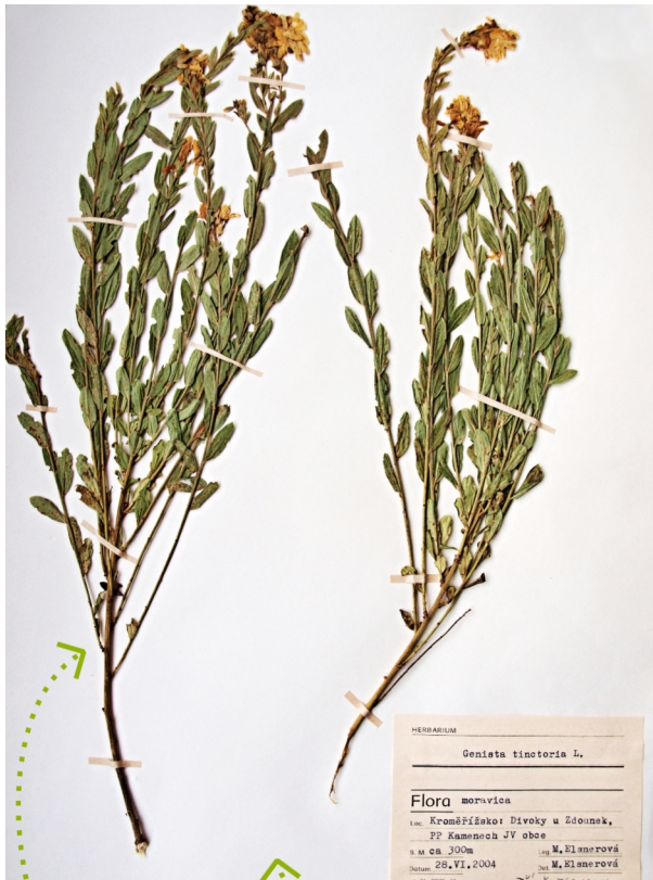
herbářová položka: list papíru, usušená vylisovaná rostlina, etiketa - scheda

Herbář je sbírka herbářových položek – usušených vylisovaných rostlin, uložených na listech papíru a opatřených etiketou ( schedou ).